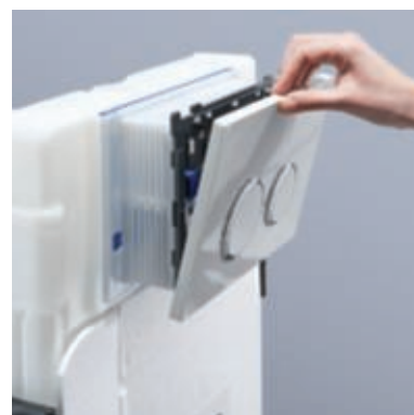
Chiusura: richiudere la placca di comando.