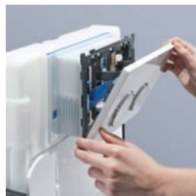
Apertura: ribaltare in avanti la placca di comando Geberit Sigma10/20/50.

Le pietre igienizzanti in uso per cassette di risciacquo devono essere prive di cloro e senza componenti ossidanti.