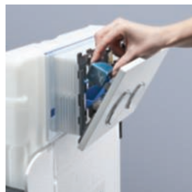
Inserimento: introdurre la pietra igienizzante nella bocchetta.