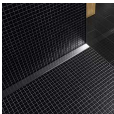
Écoulement de douche Uniflex pour le montage à la paroi

de manière optimale en hauteur, en déclivité et en désaxement à l'épaisseur, à la pente et à la trame du carrelage. La séparation complète du corps de l'écoulement et du sol en béton permet une isolation parfaite en matière de bruit et de contrainte et veille au calme et à la sécurité dans la salle de bains. Les écoulements sont rapidement et facilement accessibles pour le nettoyage.