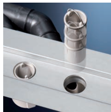
Nettoyage rapide grâce à la possibilité de retirer les siphons