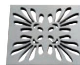
Grille stylisée, classique

La forme du siphon techniquement optimale à l'écoulement avec effet auto-nettoyant atteint une hauteur de garde d'eau de 15 mm et une capacité d'écoulement de 0,45 litre à la seconde.