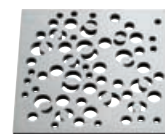
Grille stylisée, tendance