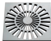
Grille stylisée, ronds