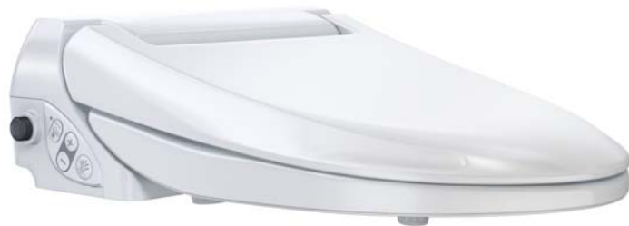
Geberit AquaClean 4000