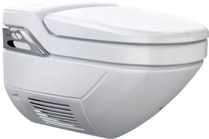
Geberit AquaClean 8000 plus