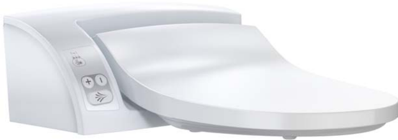
Geberit AquaClean 5000 plus