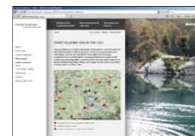
Placement bien en vue des partenaires de Geberit AquaClean sur le site Web www.i-love-water.ch