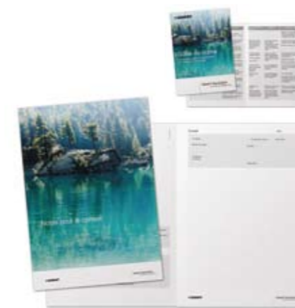
Bloc de conseils dans le look de la campagne et guide de poche pratique servant de fil rouge pour mener avec succès vos négociations commerciales avec les clients.

Profitez de l'occasion pour devenir partenaire de Geberit AquaClean. Vous bénéficierez ainsi d'un soutien marketing complet. En voici un petit aperçu: