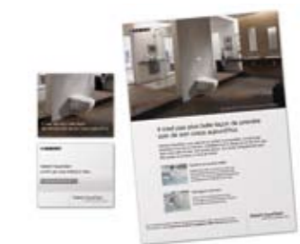
Bannière, modèles d'annonces ainsi qu'images et logos de partenaire à télécharger.