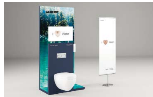
Système modulaire POS en trois tailles, avec produits d'exposition, Rollup, présentoir à brochures et écran plat en option.

Geberit AquaClean se situe entre la douche à jet de pluie et le bain bouillonnant et se présente au client comme un produit de bien-être augmentant la qualité de vie. En tant que partenaire de Geberit AquaClean, vous marquez des points grâce à un équipement attrayant et proche de la campagne pour vos locaux et vitrines d'exposition en augmentant la reconnaissance du produit et en vous assurant de solides arguments de vente.