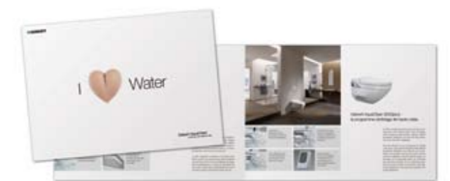
Les brochures Geberit AquaClean invitent le client à se plonger dans le sujet.