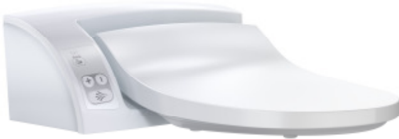
Geberit AquaClean 5000 plus