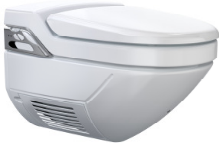
Geberit AquaClean 8000 plus

Noch komfortabler als das Basismodell ist das Geberit AquaClean 5000 ausgestattet. Die oszillierende Dusche sorgt mit gleichmässigen Hin- und Herbewegungen des Wasserstrahls für besonders gründliche Reinigung. Die Geruchabsaugung wird aktiviert, sobald sich der Benutzer auf die Toilette setzt – unangenehme Gerüche können sich erst gar nicht im Raum verteilen. Das Geberit AquaClean 5000 plus ist das Multitalent unter den WC-Aufsätzen. Mit zahlreichen zusätzlichen Duschfunktionen und regulierbarem Warmluftföhn für die Trocknung wird der Toilettengang zum ganz persönlichen Wohlfühlprogramm.