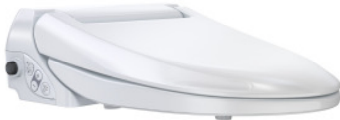
Geberit AquaClean 4000

Mit innovativen Lösungen in der Sanitärtechnik verbessert Geberit die Lebensqualität der Menschen langfristig und nachhaltig. Dies ist keine Idee auf Papier, sondern täglich gelebte Realität. Das Papier wird bei der Reinigung der Zukunft sowieso weggelassen: Bei allen Geberit AquaClean Modellen reinigt ein warmer Wasserstrahl den Po sanft, berührungslos und sauber. Wie viel Komfort und wie viele verschiedene Funktionen dabei gewünscht werden, kann jeder selbst entscheiden.