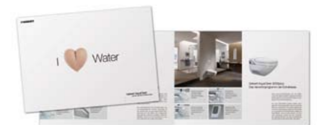
Geberit AquaClean Broschüren laden den Kunden zum Vertiefen ein.