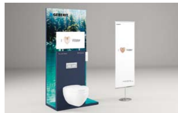
Modulares POS-System in drei Größen mit Produktexponaten, Rollup, Broschürensteller und optionalem Flachbildschirm.

als Wohlfühlprodukt zur Steigerung der Lebensqualität vorgestellt. Als Partner von Geberit AquaClean punkten Sie dank kampagnenaher, ansprechender Ausstattung für Ihre Ausstellungsräume und Schaufenster mit Wiedererkennungswert und sichern sich starke Verkaufsargumente.