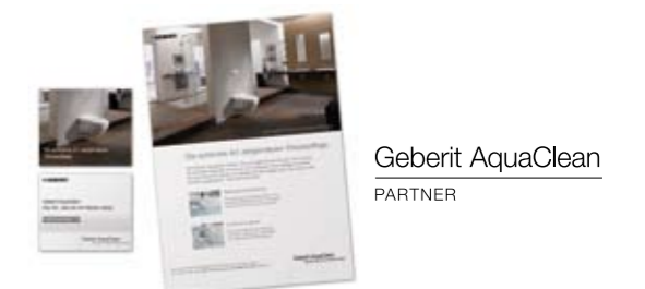
Banner, Anzeigenvorlagen sowie Bilder und Partner-Logo zum Herunterladen.