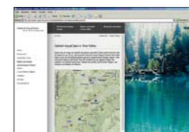
Prominente Platzierung der Geberit AquaClean Partner auf der Website www.i-love-water.ch