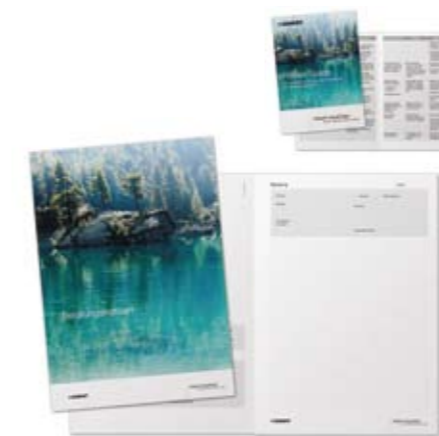
Beratungsblock im Look der Kampagne und praktischer Pocket Guide als Leitfaden für erfolgreiche Kundengespräche.